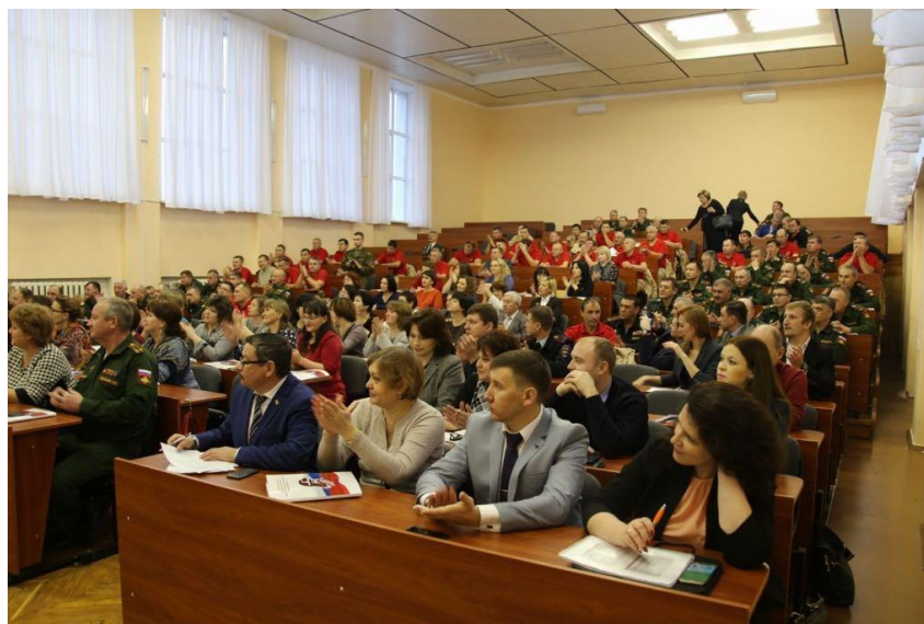
Открытый слёт военно-патриотических отрядов