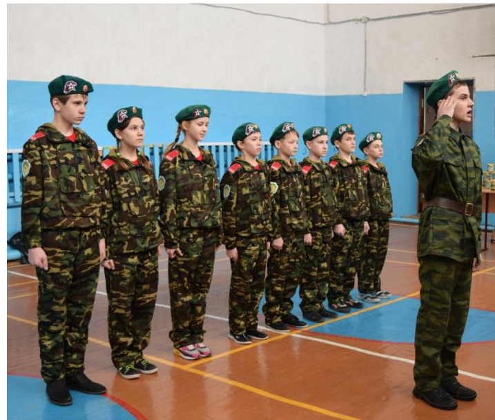
Соревнования и эстафеты